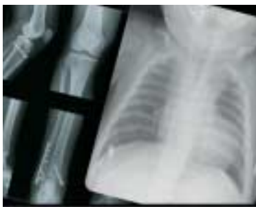
Hohe Auflösung von 508 ppi