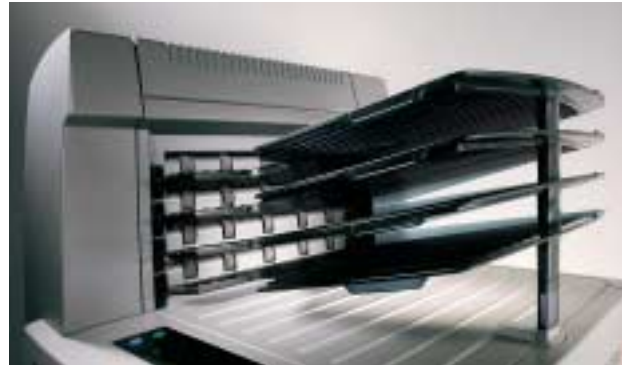
Die einzigartige Sortierfunktion vermeidet Engpässe zu Stoßzeiten

Der DRYSTAR 5503 kann mehrere Formate handhaben, die drei gängigsten Filmformate und/oder -Arten sind konstant online. Auf diese Weise kann der Imager CT-, MRI-, DSA-, digitale F&E-, CR- und DR-Bilder in hoher Geschwindigkeit auf verschiedenen DRYSTAR DT2-Medien ausgeben. Der DRYSTAR 5503 wird mit drei Eingabetablets geliefert. Jedes Eingabetablett kann fünf verschiedene Filmformate verarbeiten, von 8 x 10" bis 14 x 17", die Vielfältigkeit in der Bildverarbeitung dieser kleinen Stand-Alone-Unit ist somit absolut bemerkenswert. DRYSTAR 5503 führt für den Anwender zu größerem Komfort und Zeiteinsparungen.